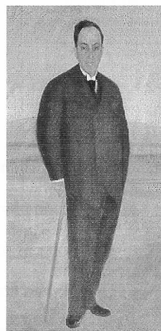
Antonio Machado, "Soledades"